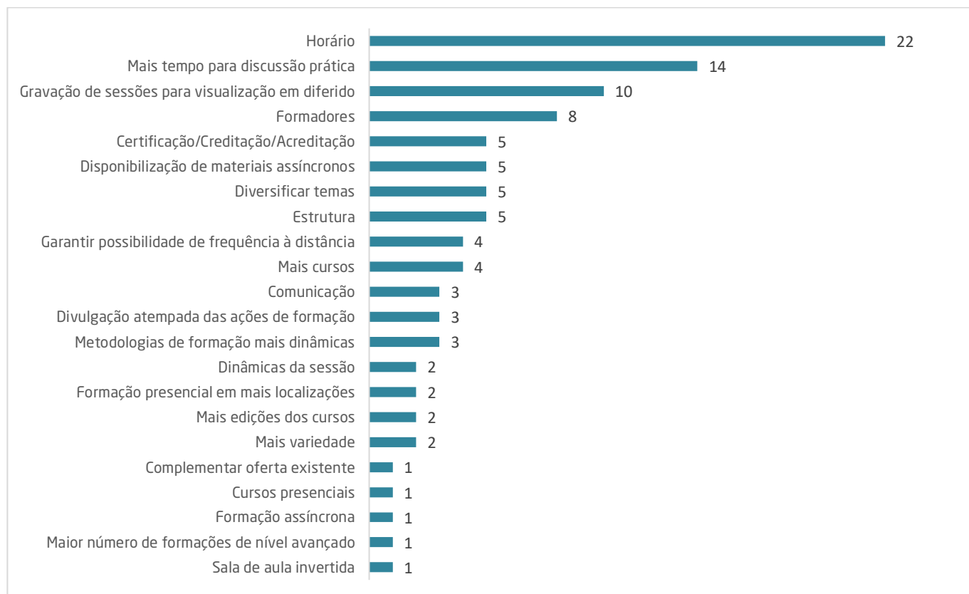
Gráfico 2. Melhorias para cursos futuros

De seguida apresentam-se as melhorias indicadas.